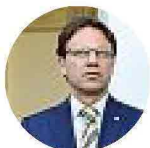
Sergio Tronzano Regione Piemonte

Il settore ha un enorme potenziale per il futuro della città